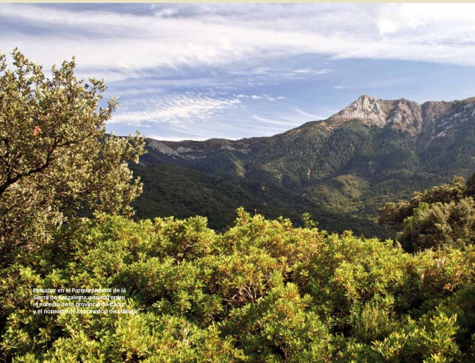
Pinsapar en el Parque Natural de la Sierra de Grazalema, situado entre el noreste de la provincia de Cádiz y el noroeste de la provincia de Málaga.