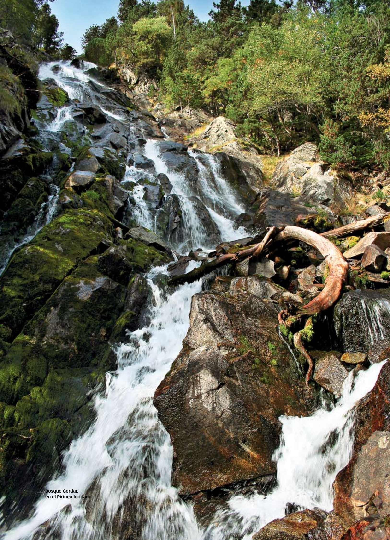
Bosque Gerdar, en el Pirineo leridano.