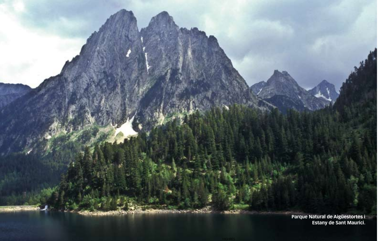
Parque Natural de Aigüestortes i Estany de Sant Maurici.