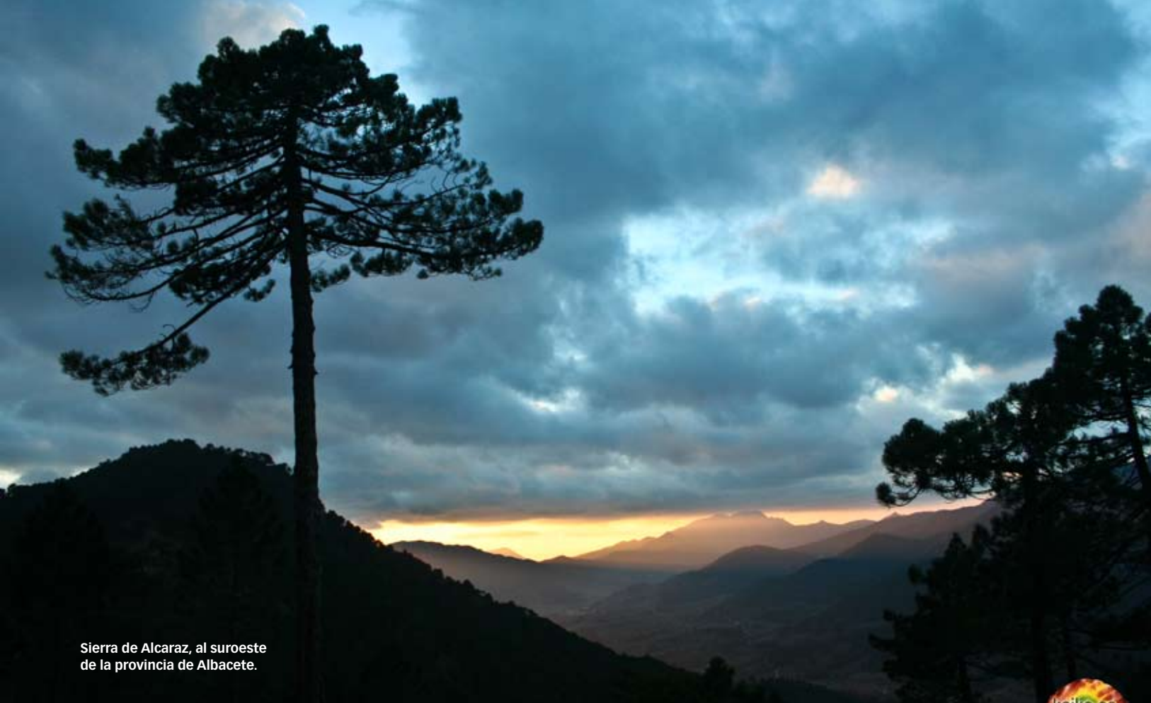
Sierra de Alcaraz, al suroeste de la provincia de Albacete.