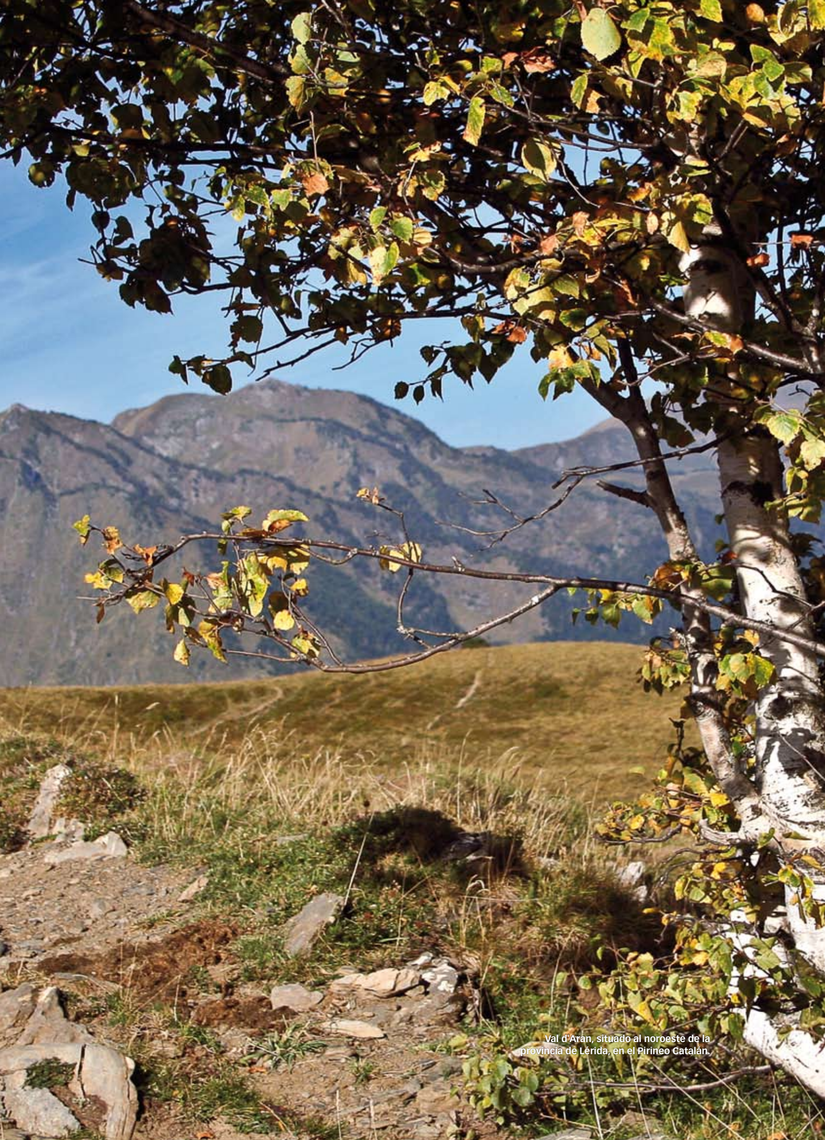
Val d'Aran, situado al noroeste de la provincia de Lérida, en el Pirineo Catalán.